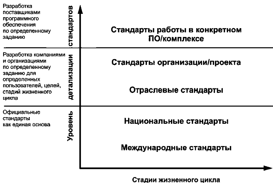
Рисунок 1 - Сферы применения стандарта информационного моделирования

- содействие применению официальных положений договоров, касающихся применяемых стандартов информационного моделирования.